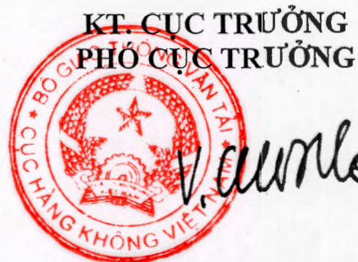
Võ Huy Cường