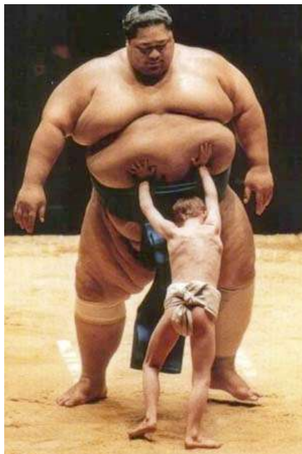
David and Goliath

Phòng Thương mại và Công nghiệp Việt Nam